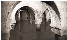
El aljibe de la Casa de las Veletas antes de la inauguración del Museo en 1933

Andando el tiempo, el edificio principal se queda pequeño y el Estado adquiere la llamada "Casa del Mono", adonde se traslada la Sección de Bellas Artes, inaugurada en 1971, mientras se emprenden obras de reforma de la Casa de las Veletas, reservada para las colecciones de Arqueología y Etnografía y por fin reinaugurada en 1976.