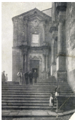
El Instituto de Segunda Enseñanza de Cáceres en 1915, primera sede del Museo.