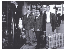
Emigrantes extremeños en Holanda

además de grabar sus iniciales "T.B." en el frente y poner un rólulo con su nombre. La maleta aún conserva parte de una papeleta de facturación de RENFE de la estación de Plasencia, y su interior había sido forrado con dos páginas del diario "La Voz de España" del 10 de Abril de 1976; este diario se editó en San Sebastián entre 1937 y 1980, y curiosamente las páginas conservadas son las que incluyen las ofertas de empleo.