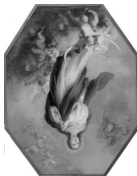
Nº 64, Abril de 2006