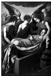
Francisco de Zurbarán. La Dormición de la Virgen

Esta valiosa exhibición de lienzos, que ponen de manifiesto la singularidad de una de las épocas más brillantes de nuestra historia como españoles y europeos, se complementa con un sistema de audíoguías que permite disfrutar de la visita con mayor intensidad, gracias a los comentarios especializados de cada una de las obras expuestas. Se trata, pues, de una ocasión difícilmente repetible de disfrutar en nuestra ciudad de las creaciones de grandes pintores fundamentales en la Historia del Arte y escasamente representados en las colecciones extremeñas.