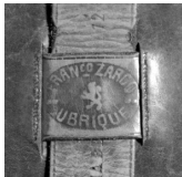
Sello del fabricante