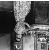
Nº 63, Marzo de 2006

Horario de apertura: Martes a sábados: 9.00 - 14.30 y 16.00 - 19.15 Domingos: 10.15 - 14.30 (Sección de Bellas Artes cerrada por las tardes) Horario de apertura: Martes a sábados: 9.00 - 14.30 y 16.00 - 19.15 Domingos: 10.15 - 14.30 (Sección de Bellas Artes cerrada por las tardes)e-mail: museo@ccacres.es tlf: +34 927 01 08 77 fax: +34 927 01 08 78 http://www.museoacacres.com