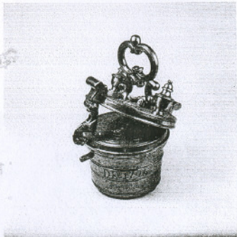
Marco patrón de Castelo de Vide (1796)