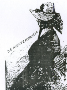
La más antigua imagen conocida de la gorra (1888)

La gorra se consideró siempre como una prenda de trabajo, cuya finalidad era la de proteger el rostro de las mujeres que salían a realizar faenas agrícolas o que se desplazaban a pie o en caballerías al mercado semanal de Plasencia, en el que su presencia ha contribuido a enriquecer la típica imagen del mercado placentino, plasmada por Sorolla, Caldera o R. Morales.