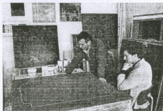
Septiembre: 100.000 visitantes

Merced al intercambio establecido, del 16 al 30 de Septiembre ha podido visitarse en el Centro Municipal de Cultura de Castelo de Vide la exposición de estos artistas cacereños que estuvo en el Museo de Cáceres en Abril del presente año.