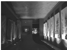
Nº 43, Mayo de 2004