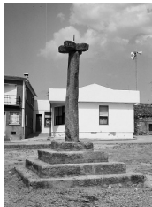
Mesas de labor (antes de la última intervención)

Posteriormente, las picotas conviven y poco a poco van siendo sustituidas por los rollos, monumentos dedicados a expresar públicamente la capacidad jurisdiccional de la villa, de ahí que se adornen habitualmente con los blasones reales o del linaje señorial a que pertenece la villa. Los rollos asumen también la función punitiva de las picotas y, si bien son la plasmación de la autonomía municipal, también son la expresión del vasallaje y el sometimiento al poder señorial de buena parte de las villas españolas; seguramente por ello, las Cortes de Cádiz decretaron en 1813 su demolición, orden que se repitió en posteriores momentos de gobiernos liberales y que afortunadamente fue desobedecida en una buena parte de las poblaciones cañerías.