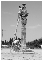
El equipo de investigación de la muestra, midiendo el rollo de Moraleja

El Museo de Cáceres desea agradecer la ayuda prestada a todas las personas e instituciones que han colaborado en la preparación de la muestra, especialmente a aquellos ayuntamientos que respondieron a nuestra demanda de información.