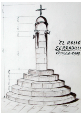
El rollo de Serradilla tras su reciente reconstrucción (dibujo de Emilio González Núñez)