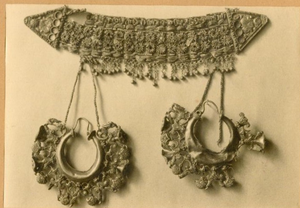
Del Tesoro fenicio de Aliseda

Didama y arracadas del Tesoro de Aliseda, 1920.