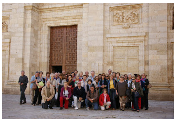
Socios de «Adaegina» en el viaje a Medina de Rioseco

Como es costumbre, la finalidad de la reunión es aprobar la memoria anual de las actividades de la sociedad durante el año 2013 que finaliza, así como las cuentas correspondientes al ejercicio, y aprobar el programa de actividades para el próximo año 2014 y el presupuesto económico que será necesario para llevarlas a cabo. Así mismo, se renovará la Junta Directiva tal como establece el Estatuto, de modo que los socios interesados podrán presentar sus candidaturas durante el desarrollo de la Asamblea.