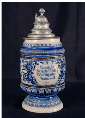
Jarra de cerveza de Munich (Alemania)

Finalmente, se llama la atención sobre la escritura como medio de comunicación, a través del cual las personas de hace cientos o miles de años han podido transmitir mensajes de todo tipo, desde las cuentas de una transacción comercial a útiles consejos para la vida. Son mensajes que nos dejaron escritos en el tiempo.