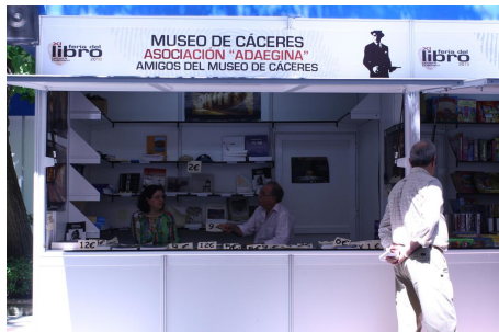
Caseta de "Adaegina" en la XI Feria del Libro (2010)

Por tercer año consecutivo, la Asociación "Adaegina" Amigos del Museo de Cáceres, y el propio Museo, están presentes en la Feria del Libro de la ciudad, ofreciendo a los lectores cacereños una amplia selección de las publicaciones del Museo a un precio muy ventajoso