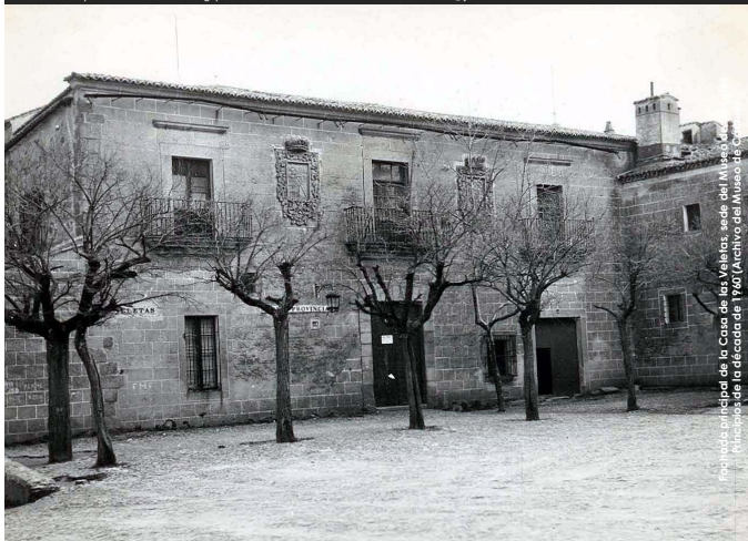
Fotografía principal de la Casa de las Veletas sede del Museo de Cáceres. (Archivo del Museo de Cáceres)

e-mail: museocaceres@juntaextremadura.net