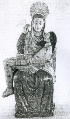
Piedad Talla en madera policromada

No lo olvide: Inauguración de la exposición el Sábado, 3 de marzo a las 20,00 horas.