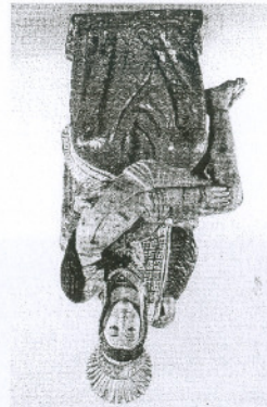
Nº 10. Febrero de 2001

Horario de apertura: 10003 Cáceres, Plaza de las Veletas, 1 Domingos: 10,15 - 14,30 y 16,00 - 19,15 Martes a sábados: 9,00 - 14,30