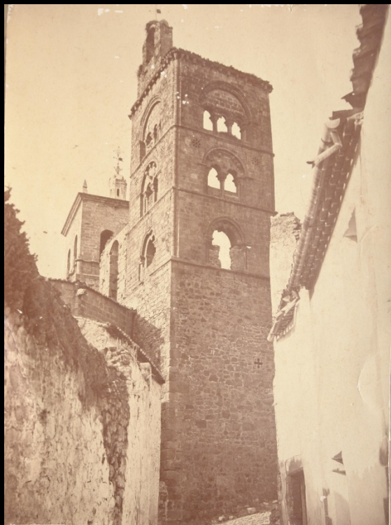
Torre en ruinas de la Iglesia de Santa María, Trujillo. 1870. Fotografía de Jean Laurent (Archivo fotográfico del Museo de Cáceres)