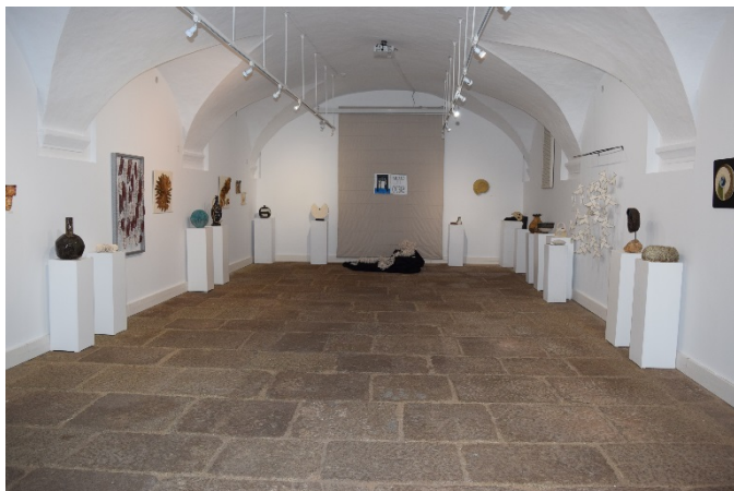
Una vista de la exposición «Con barro 2018»

Continuando con la colaboración establecida el año pasado con nuestro Museo, la exposición «Con barro 2019» es una iniciativa que parte del Taller de Cerámica (turno de tarde) de la Escuela de Bellas Artes «Eulogio Blasco» de la Diputación Provincial de Cáceres.