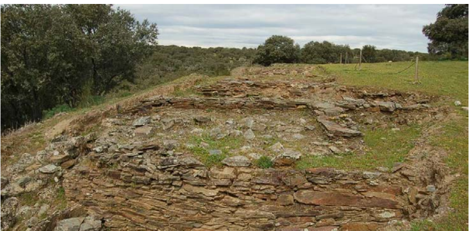
Vista parcial del castro de Villasviejas del Tamuja

La moneda, tanto por su escritura como por su iconografía, es celtibérica, pero con la particularidad de que podría ser la única acuñada fuera del Valle del Ebro. El topónimo tamusia se habría conservado en el nombre del río Tamuja, que rodea el castro vetón de Villasviejas del Tamuja, en Botija (Cáceres), por lo que se ha identificado ese yacimiento con la ciudad de Tamusia . Sin embargo, teniendo en cuenta que los vetones no acuñaron moneda, por la tipología de la moneda que es la Pieza del mes, se trata de una moneda celtibérica que imita las monedas de sekaiza , acuñadas en la ciudad de Segeda, localizada en la provincia de Zaragoza; monedas igualmente habituales en yacimientos extremeños. Es probable que, como cita el historiador romano Plinio, pueblos celtiberos se desplazaran hasta la actual Extremadura, tal vez gentes de sekaiza y Tamusia llegaron para servir como tropas mercenarias durante las Guerras Sertorianas o como mano de obra para la explotación minera de la región; en el campamento de Cáceres el Viejo han aparecido numerosos ejemplares de estas monedas.