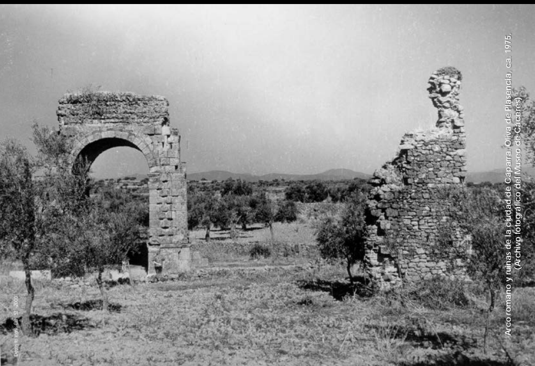
Arco romano y ruinas de la ciudad de Caparral, Oliva de Plasencia, ca. 1975.