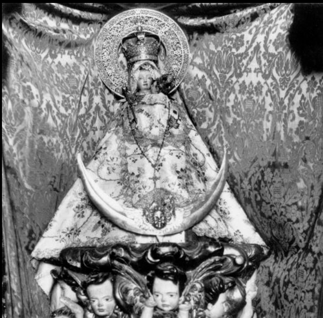
Imagen de Nuestra Señora de la Montaña (Cáceres), ca. 1960.