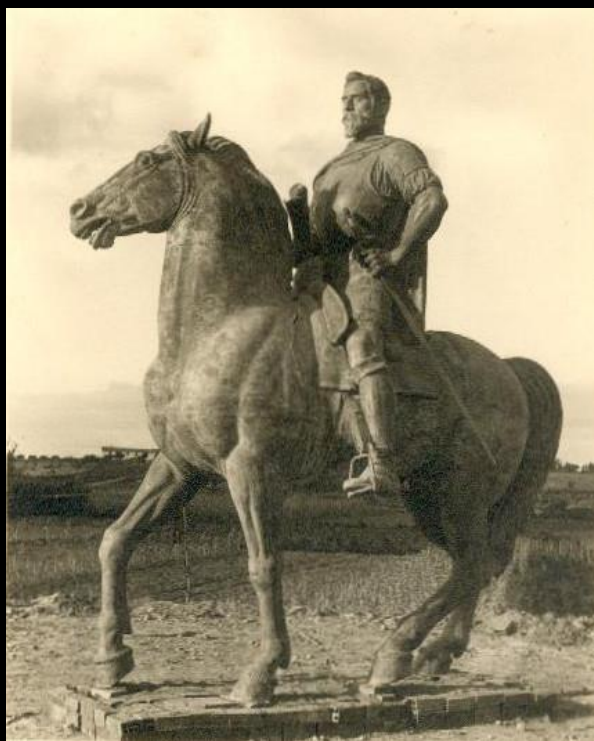
Escultura ecuestre en bronce de Pedro de Valdivia, Santiago de Chile. Por Enrique Pérez Comendador. 1962.